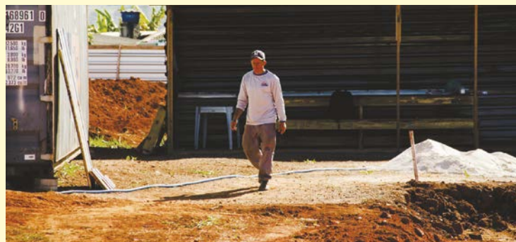
Canteiro de Obras da escola em tempo integral no Portal do Cerrado: destaque na Educação

feitura também dará o pontapé inicial a um grande programa ambiental. Segundo Márcio Corrêa, serão plantadas 500 árvores nativas do cerrado em