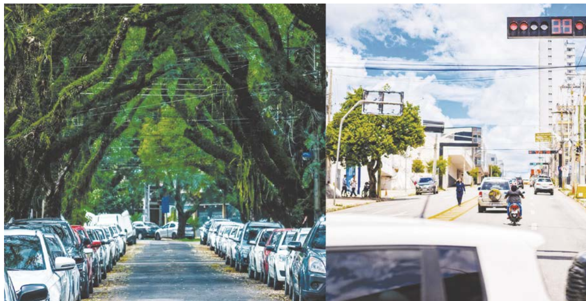
Avenida em Maringá e a Avenida Goiás, em Anápolis: todo o potencial para desenvolver a preservação sem atrapalhar o desenvolvimento