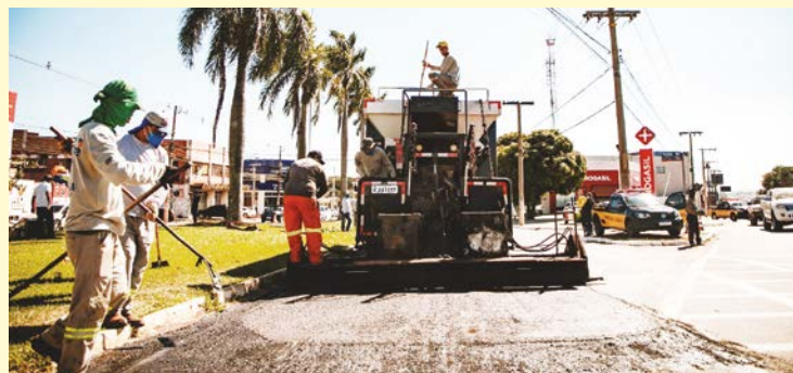
Programa de asfaltamento "De Ponta a Ponta" promete completar pavimentação em bairros