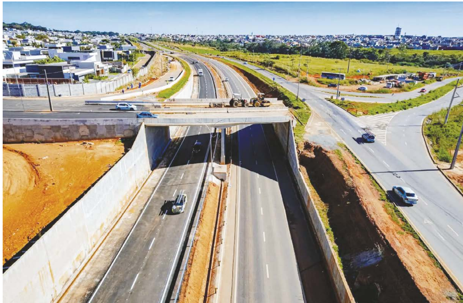
O tão tão... tão esperando viaduto deve enfim ficar pronto para aliviar tráfego no eixo Norte-Sul: parte da programação de aniversário

Corrêa também anunciou, como noticiado pelo AD em primeira mão, que a antiga edificação do Ipasgo, na Avenida São Francisco, no Jundiá, será convertida em um Centro Municipal de Diagnósticos. A medida, em parceria com o Governo de Goiás, quer dar fim ao gargalo dos exames e especialidades, sobretudo