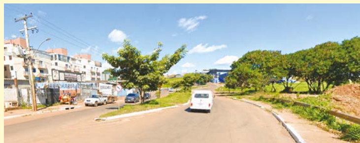
Avenida Presidente José Sarney é uma das escolhidas para a implantação do "túnel verde" com o plantio de 500 árvores