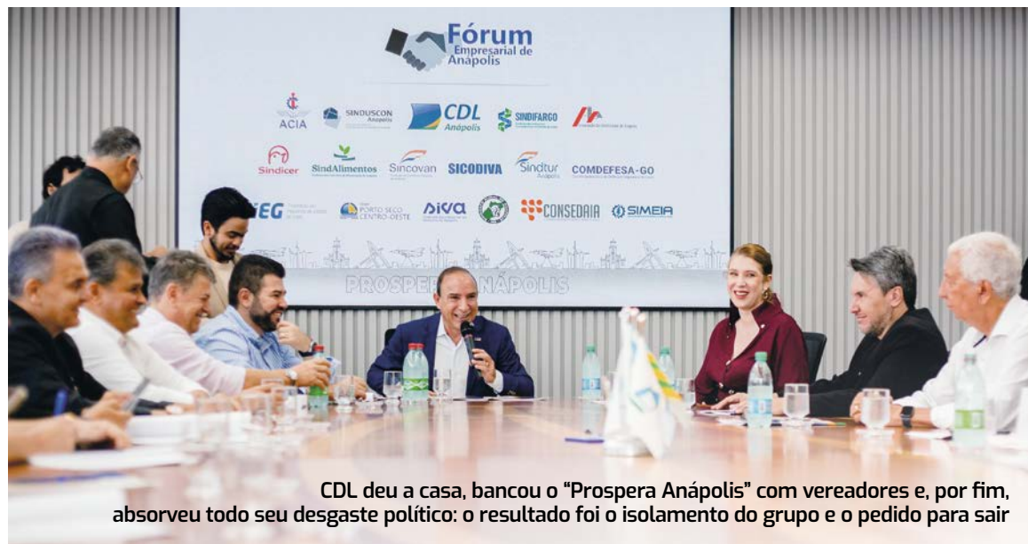
CDL deu a casa, bancou o “Prospera Anápolis” com vereadores e, por fim, absorveu todo seu desgaste político: o resultado foi o isolamento do grupo e o pedido para sair

Pelo menos eram 17 até o último domingo (28), quando o presidente da Câmara de Dirigentes Lojistas (CDL) decidiu abandonar