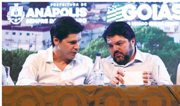
Parceria Vilela e Correa: subsídio para viabilizar renovação da frota e redução do preço da passagem, garantem

Segundo a Urban, o déficit operacional está na casa dos R$